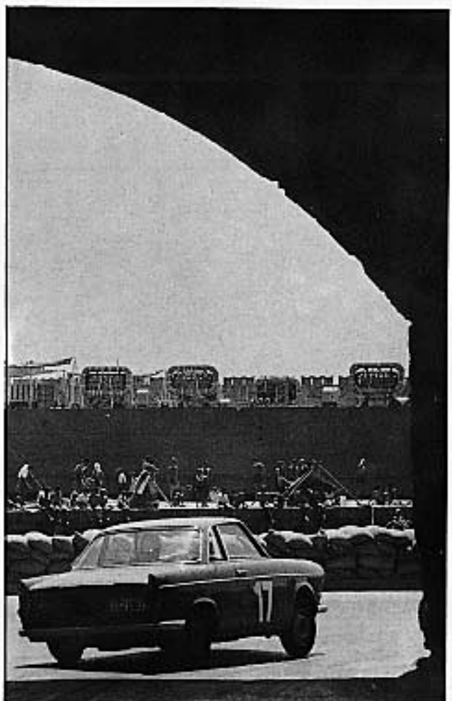
Πάλι με «Μπέ-Έμ-Βέ»: Στη Ρόδο, στην Εξοδο από τις Καμάρες. Στην παραλία δεκάδες σποκιά με ήλιο. Φέτος, στο ίδιο σημείο υπήρχαν τέσσερις άχυρομπαλλες. Γιατί;