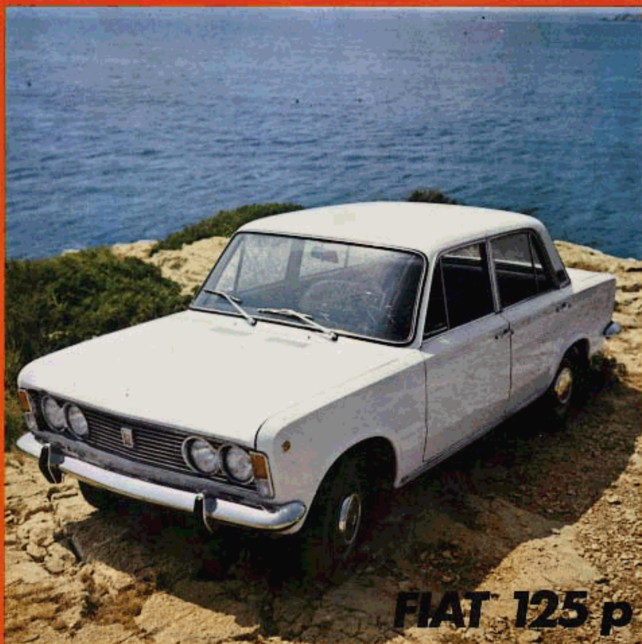
FIAT 125 p

ΤΕΣΤ: ΧΟΝΤΑ 750 ΝΟΡΤΟΝ ΚΟΜΜΑΝΤΟ Η ΕΠΙΣΤΡΟΦΗ ΣΙΡΚΟΥΙ: ΧΑΝΙΑ - ΚΕΡΚΥΡΑ